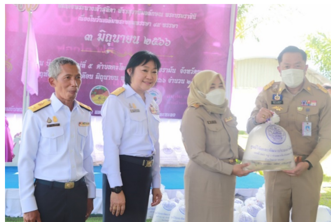
แหล่งข้อมูล