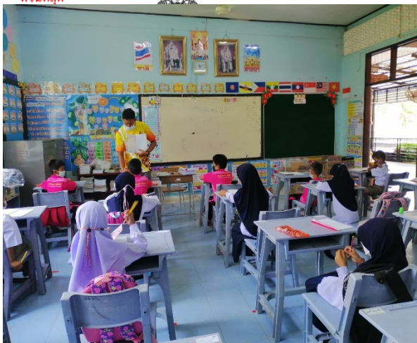
รายละเอียดผลงานด้วย ๒